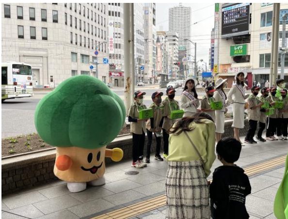
令和5年度実施の様子

令和6年4月14日(日)に、フラワーQueenとともに、募金団体である公益社団法人広島県みどり推進機構と、森林ボランティア団体、緑の少年団、広島県及び広島市が緑の街頭募金を呼びかけます。