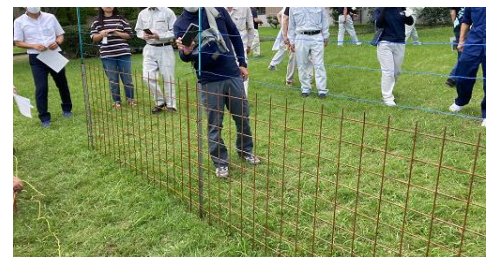
(写真)ワイヤーメッシュ電気複合柵