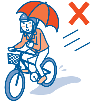
holding an open umbrella 傘差し運転