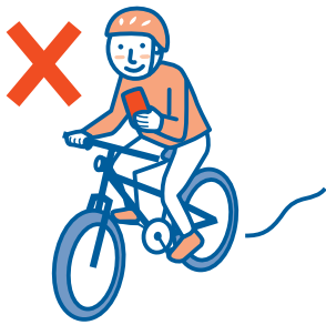
using a smartphone スマホ等使用運転